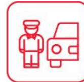
CHOFER DE REEMPLAZO