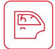
REPOSICION DE LUNAS