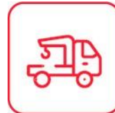
GRUA Y AUXILIO MECÁNICO