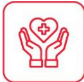
GASTOS DE CURACION, POR CADA OCUPANTE