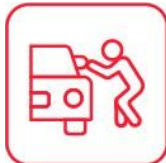
ROBO TOTAL Y ROBO PARCIAL