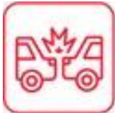
DANOS POR CHOQUE