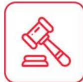
PAGOS POR RECLAMOS REALIZADOS (RESPONSABILIDAD CIVIL)